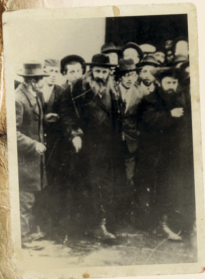
סערדאהעלי רב זצוק"ל מיט תלמידי השיבה

נאר וואס דען? מוז זיין אז די הוראה צו פסל'ן די מקוה קומט פון א תוספתא - בלתי ידועה - וואס דארט שטייט, אז שלשה לוגין איז נאר געזאגט געווארן ביי סתם מים שאובין, אבער מים טמאים טוט יא פסל'ן