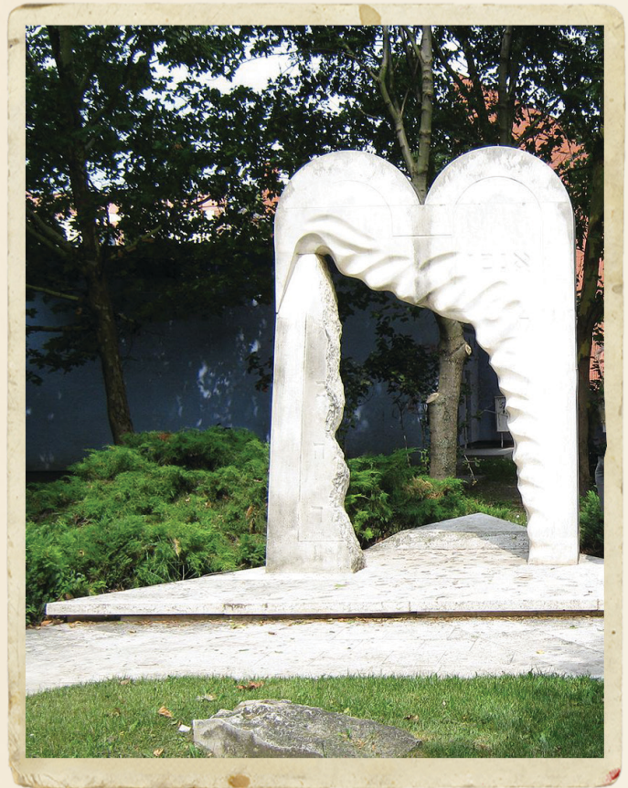
א שטאטיש אויפגעשטעלטער מאנומענט נאך די אומגעקומענע פון סערדאהעלי, הי"ד