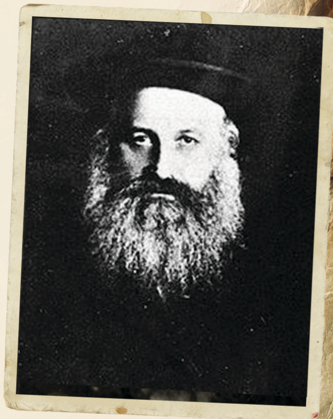
כ"ק הגה"ק מסערדאהעלי זי"ע, הי"ד

דאס זעלבן האבן זיינע מדות און הנהגות גאר הויך ארויסגעשיינט צווישן אנדערע קינדער. ער האט כמעט ווי נישט געשפילט אפילו אין די קינדערישע יארן. כל זמנו האט ער מקדיש געווען פאר תורה. זיין דיבור איז פון קליינערהייט אן געווען געמאסטן און געוואויגן, און נישט גערעדט קיין איבריג ווארט. די דאזיגע הנהגה און ערענסטקייט האט ער שפעטער איינגעפלאנצט בי די פילע תלמידים אין זיין אייגענעם ישיבה אין סערדאהעלי.