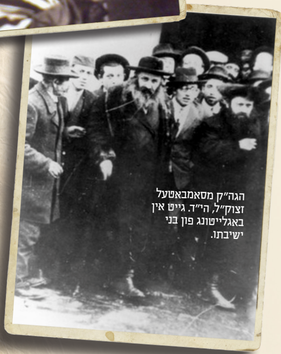
הגה"ק מסאמבאטעל זצוק"ל הי"ד. גייט אין באגלייטונג פון בני ישיבתו.