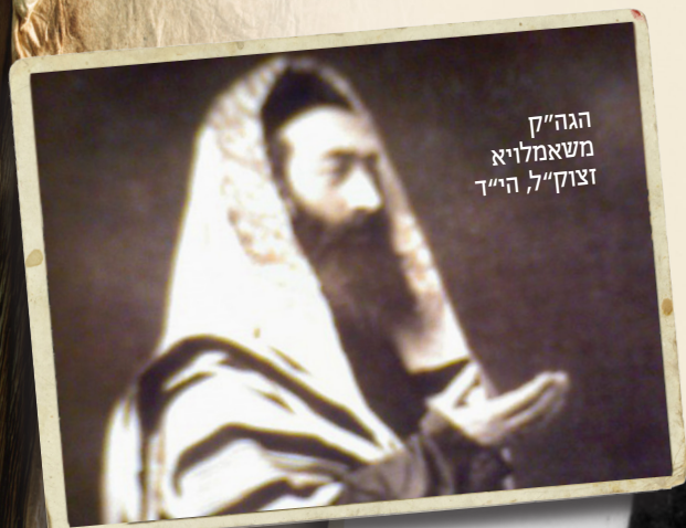
הגה"ק משאמליא זצוק"ל הי"ד