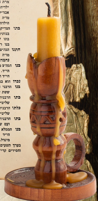
אין מבוא פון ספר 'פיוול בפרדס'.

בערך תשעים נפשות יקרות, וכל קהלתו, קהלת שאמלויא יראים ונאמנים, שלמים חסידים קרי' באמנה צדק ליון בה הי"ד, אשר אנו מצפים בכליון עינים שיצמדו לתחי' במרתה בימינו א"ס.