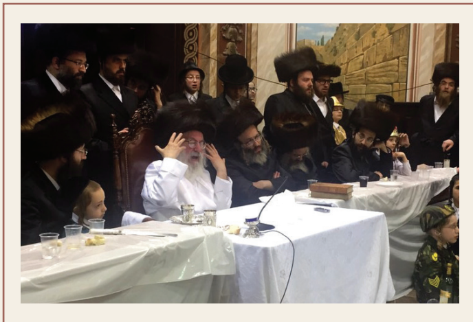
'איך וויל זאגן א ווארט פון הייליגן חתם סופר'. - ביים טיש ביום הפורים.

ביי אונז בני קהילתנו הקדושה ליגט מיט א העכערקייט אויפגענומען די דברים חוצבים להבות אש, איבער'ן העכערן נאנטשאפט 'צום הייליגן חתם סופר זי"ע וואס כ"ק מרן רבינו